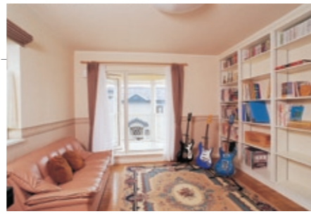
ご主人の宝物が並ぶ2階の洋室。個室は圧迫感を出さないため、壁に合わせた白い本棚を造作した。