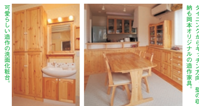
可愛い造作の洗面化粧台。

DATA 構造規模/木造・2階建て、延床面積/163.07㎡(約49坪)、<主な外部仕上げ>屋根/ファイバーシングル、外壁/防火サイディングテラコート塗、建具/玄関ドア:ガデリウス、窓:トステムマイスターⅡ、<主な内部仕上げ>床/カバ無垢フローリング、壁/クロス・パイン羽目板、天井/クロス、<断熱仕様>床下/キュービックフロー 235mm、壁/高性能グラスウール 16kg140mm、天井/ブローイング 300mm、<暖房方式>オール電化(蓄熱式) ●工事期間/平成16年10月~平成17年5月(約5ヵ月)