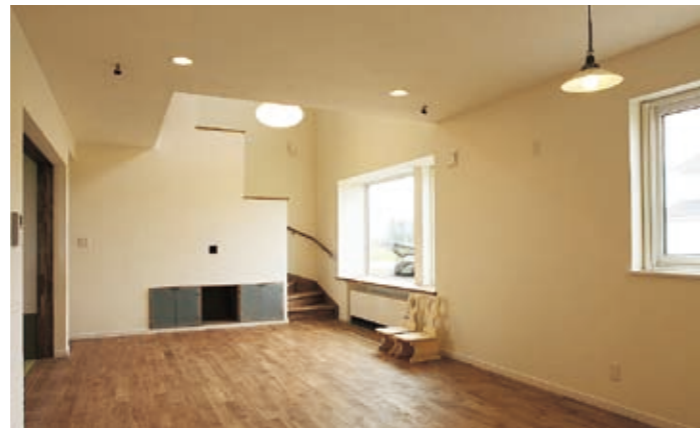
キッチンからリビング方向を望む。キッチンに立つと、リビング・ダイニングから隣接する和室まで、全体に目が届く