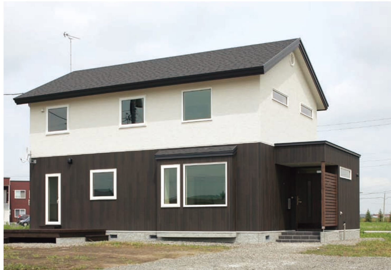
シンプルな切り妻屋根を生かした外観