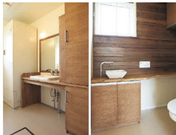
右: トイレにも木の質感を生かしたデザイン壁が 左: 生活用品など細々とモノを置きがちな洗面所には、収納力抜群の洗面化粧台を造作した