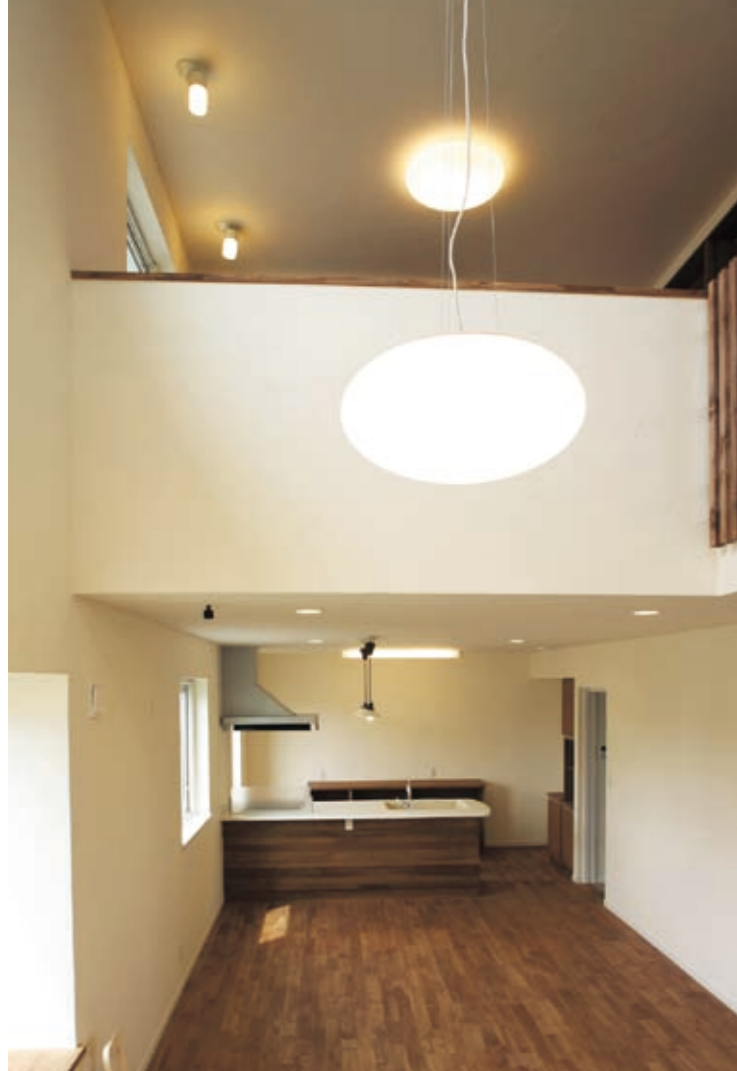
一体空間のLDK上部には大きな吹き抜け。 2階ホールで読書をしていても、階下の様子が伝わってくる